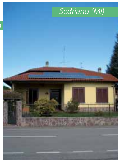
Impianto fotovoltaico da 2,88 kWp

Quadri, cavi, interruttori ed eventuali ulteriori dispositivi di protezione sono i componenti elettrici che completano l'impianto.