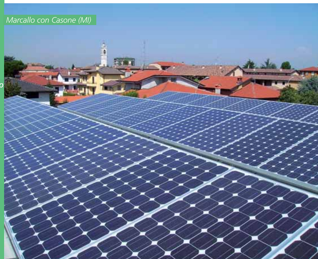
Impianto fotovoltaico da 19,2kWp

La produzione elettrica annua di un impianto fotovoltaico può essere stimata attraverso un calcolo che tiene conto: